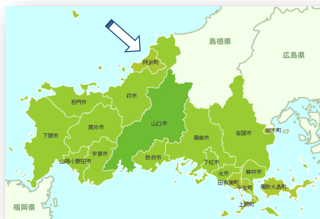
山口県阿武町の位置