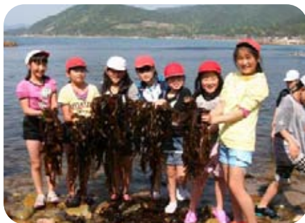
初日 磯探検（海岸でのワカメ採り）