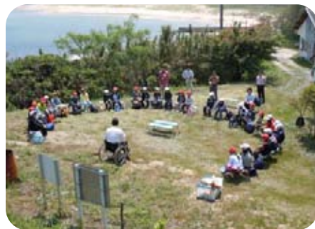
入村式の様子（遠岳野営場）