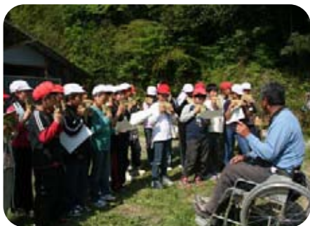
2日目 バンブー笛体験（あったか村）

下関市立名池小学校の5年生28人が阿武町（農山漁村）の生活を体験!! 下関市立名池小学校の5年生28人が、5月17日～20日まで4日間、阿武町で農山漁村の生活を体験しました。 これは、子どもたちの学ぶ意欲や自立心、思いやりの心、規範意識などを育み、成長を支えることを目的に、農林水産省、文部科学省、総務省が連携して推進する「子ども農山漁村交流プロジェクト」の一環として、阿武地域グリーンツーリズム推進協議会が受け入れたもので、受入は今回の名池小学校で3校目となりました。