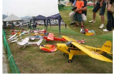
福賀飛行クラブのラジコンコーナー