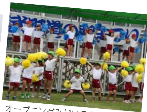
オープニングみどり保育園児の遊戯