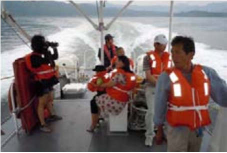
巡視艇さざんかの体験航海