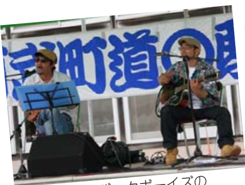
ジターバックボーイズの ギター＆ウクレレライブ