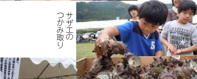
サザエの つかみ取り