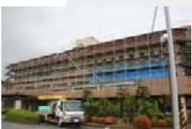
耐震改修工事が進む役場本庁舎

○内容 庁舎の耐震補強工事、庁舎内外の改修工事、エレベーターの設置、議会傍聴用のスロープの新設などバリアフリー化工事