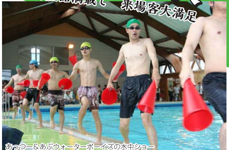
あつー&あぶウォーターボーイズの水中ショー

「第20回阿武町道の駅まつり」が6月5日に道の駅阿武町で開催されました。道の駅下の新奈古漁港では各テナントの販売に恩恵のある魚介類・果菜類に感謝し、諸霊を慰める供養祭が行われ、続いて県外海第二栽培漁業センターの協力により贈られたカサゴの稚魚500匹などを、みどり保育園の子どもたちが海に放流する放魚祭が行われました。