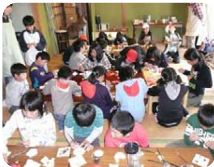
3日目 絵付け教室（上沢堂）