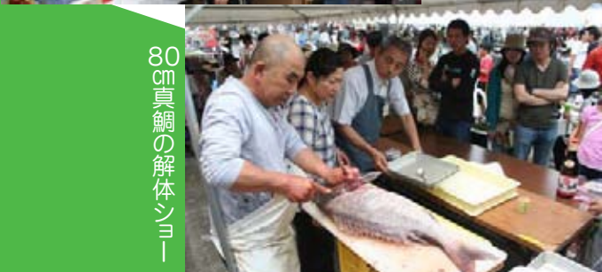
80cm真鯛の解体ショー