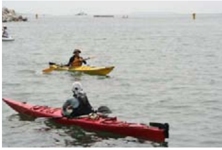
ギ・パドラーズ GI-Paddlersの試乗会