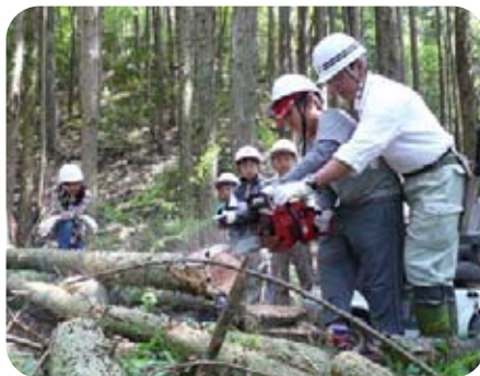
3日目 間伐体験（福賀山林）