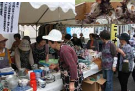
ふたば会の 福祉の市