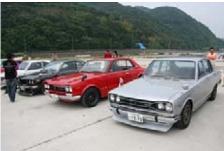
マニア必見 往年の名車展示