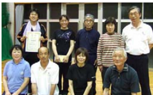
ソフトバレーボールで優勝された皆さん