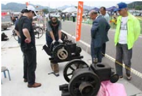
なつかしー 発動機展示