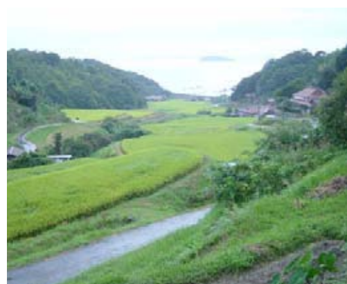
宇田郷の宇田中央・田部地区

○基準単価の活動に加え、自立的かつ継続的な農業生産活動等の体制整備に向けた前向きな取り組み