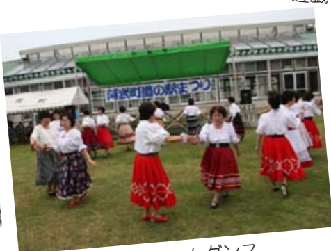
奈古フォークダンス