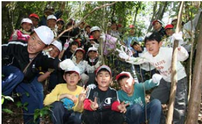
山登り体験（あったか村）

下関市立名池小学校の5年生28人が阿武町（農山漁村）の生活を体験!! 下関市立名池小学校の5年生28人が、5月17日～20日まで4日間、阿武町で農山漁村の生活を体験しました。 これは、子どもたちの学ぶ意欲や自立心、思いやりの心、規範意識などを育み、成長を支えることを目的に、農林水産省、文部科学省、総務省が連携して推進する「子ども農山漁村交流プロジェクト」の一環として、阿武地域グリーンツーリズム推進協議会が受け入れたもので、受入は今回の名池小学校で3校目となりました。