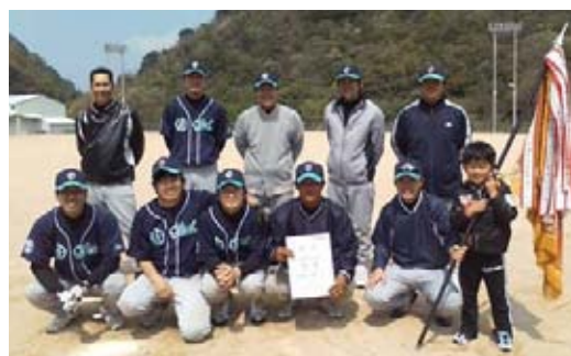
優勝した大井クラブの皆さん