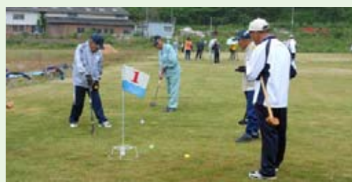
5/28には芝生広場でこけら落とし 阿武町グラウンド・ゴルフ大会を開催