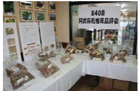
阿武萩乾椎茸品評会