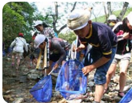
2日目 小川体験（あったか村）