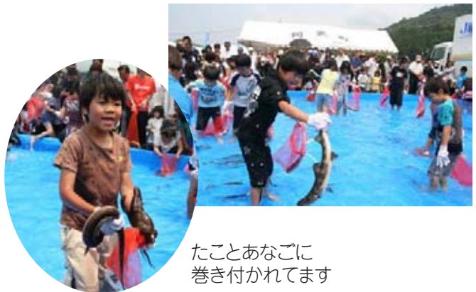
たことあなごに 巻き付かれてます