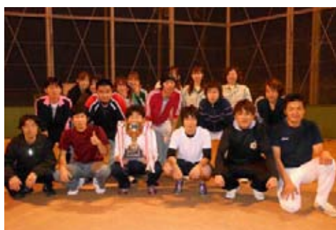
優勝したナベルズの皆さん