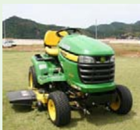
導入された芝刈り機

阿武町の国体会場である「道の駅阿武町隣接広場」では、昨年6月町民ボランティアの手で植えた芝生がすっかり生え揃い、美しい緑のじゅうたんとなっています。