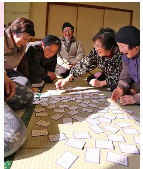
“散らし取り”を楽しむみなさん

また、中学生も学校でかるたを行っていることから、「中学生に挑戦してみようか?」との話に盛り上がり、来年は以前行われていたように地域のひとと中学生のかるた取りが楽しめる…かも!?