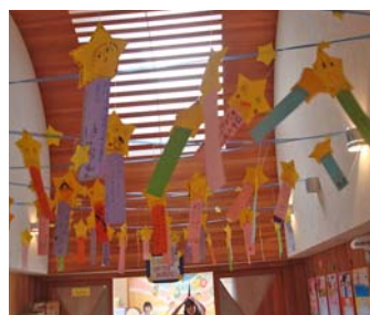
たなばたかざり(7月)

端午の節句。こいのぼりを空高く泳がせるのは、実に気持ちがよく、最高のデモンストレーションです。