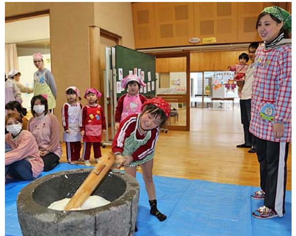
力を込めておもちつき