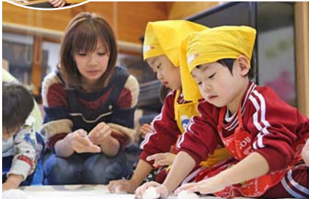
もちを丸める姿も真剣

みどり保育園の餅つき大会が1月18日、本園・分園で盛大に開催され、保護者や子どもたち総勢150人が参加しました。 保護者会のおとうさんがもちをついた後、子どもたちが子ども用のきねで「よいしょ！よいしょ！」のかけ声とともにほっかほかのもちをつきあげました。つきあがった白・緑・ピンク色の三種類のもちを、おばあちゃんやお母さんが切り分け、子どもたちは顔や服を真っ白にしながらかもちを丸めました。その後、全員であんこもち、きな粉もち、しよゆもちをおなかいっぱい食べました。