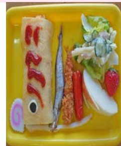
こいのぼりランチ(5月)