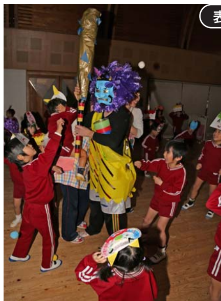
保育園に鬼がやってきた!