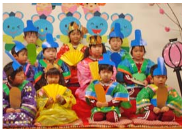
おひなさまランチ(3月)