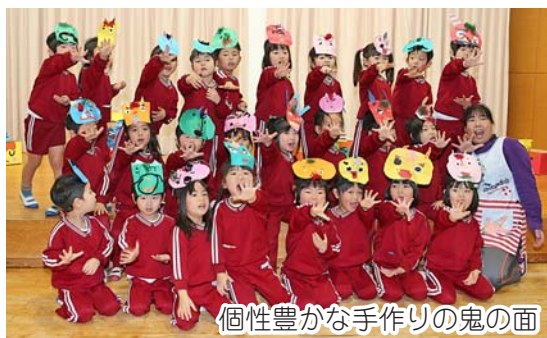
個性豊かな手作りの鬼の面

「鬼は外!」「福は内!」と園児の元気の良い声が2月3日、みどり保育園にひびきわたりました。恒例の節分の豆まきが、JAあぶらんど萩の職員さんの協力により開催され、「いじわる鬼」「泣き虫鬼」「のろま鬼」「好き嫌い鬼」の4匹の鬼が保育園にやってきました。子どもたちは、豆のかわりにカラーボールを投げつけ鬼を撃退。日頃自分たちの心の中にいる悪い鬼を追い出し、これから「良い子」で生活することを約束しました。