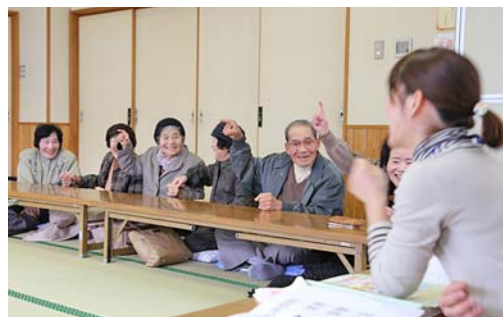
手を使って軽い運動中