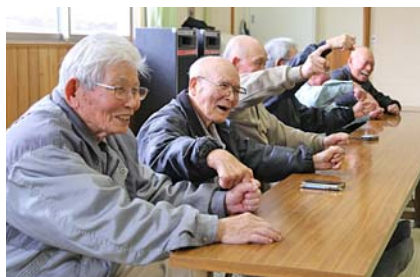
楽しい会に笑顔いっぱい