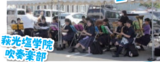
萩光塩学院吹奏楽部