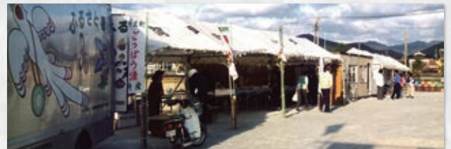
道の駅社会実験の様子