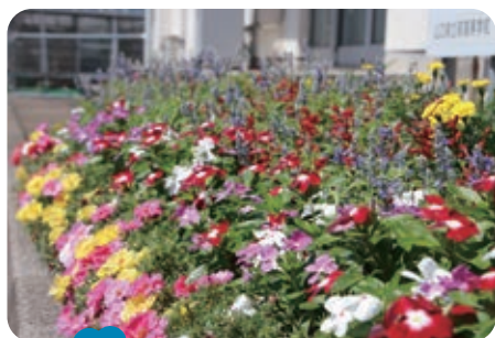
New 奈古分校 農場花壇