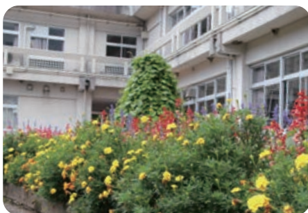
福賀小学校 学校花壇