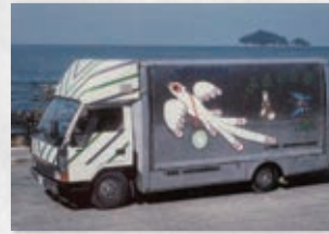
展示卸売車「ふるさと君」