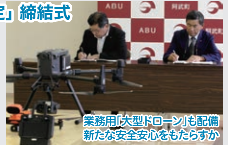
業務用「大型ドローン」も配備 新たな安全安心をもたらすか