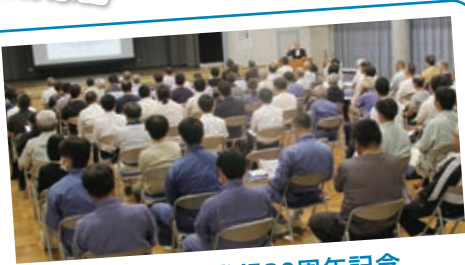
8月19日 道の駅登録30周年記念 “道の駅の生みの親”大石久和氏講演会