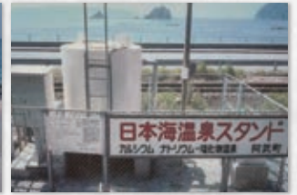
日本海温泉スタンド