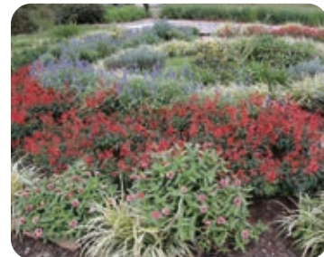
四つ葉サークル花壇(宇生賀中央)