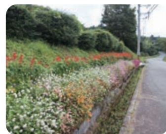
福賀ことぶき会花壇