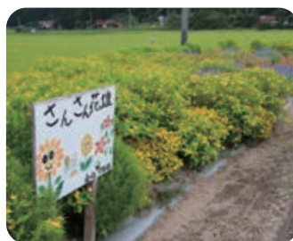
さんさん花壇 (金社自治会 女性部)