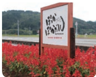
ほっかほかだん (福の里女性部)