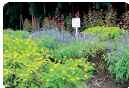
栃原ほかほか花だん(栃原自治会)