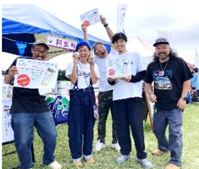
▲町外開催イベント（出展）