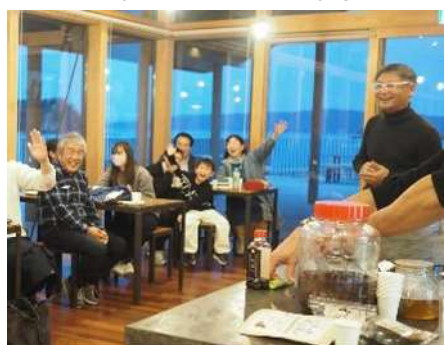
▲町内開催イベント（主催）