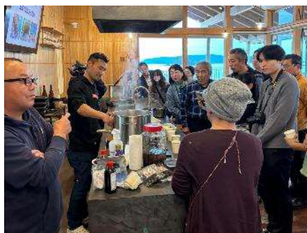
▲町内開催イベント（主催）