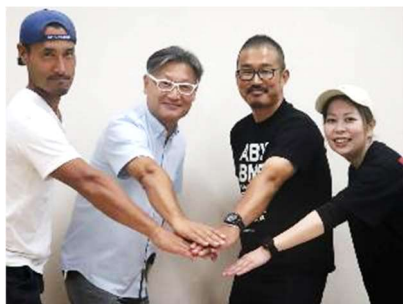
▲一般社団法人あぶナビ