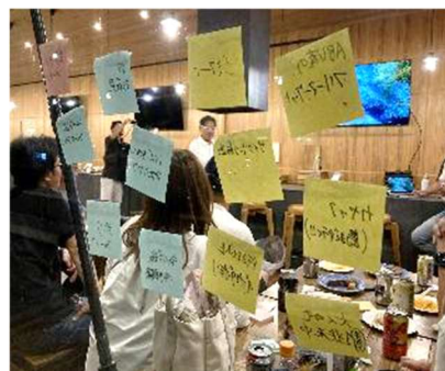
▲アンバサダー限定イベント（主催）