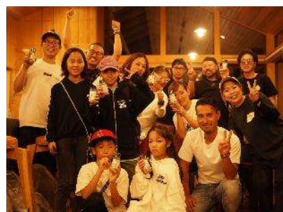
▲ABU Normal Ambassador