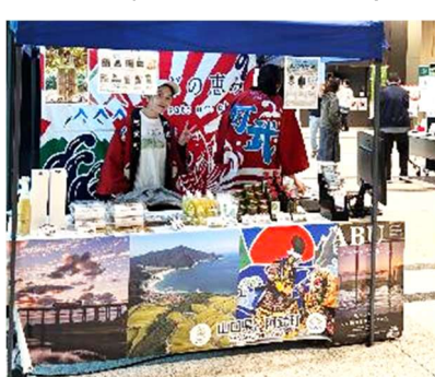
▲町外開催イベント（出展）