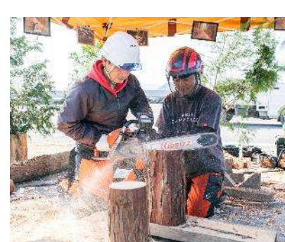
▲体験プログラム一例「スウェーデンソーチ作り」

Iターン・Uターン・地元居住者の混成チームによる観光振興と一緒に取り組む地域おこし協力隊員を募集しています！